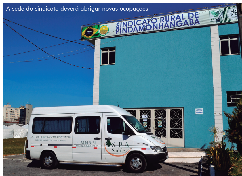
A sede do sindicato deverá abrigar novas ocupações

O presidente tem planos para diversificar e buscar novas rendas para o sindicato que possui uma área de 22.000 m 2 , onde está instalada sua sede própria. “Nosso objetivo é juntar esforços para melhor utilização do terreno, com consequente aumento de renda para o sindicato. A