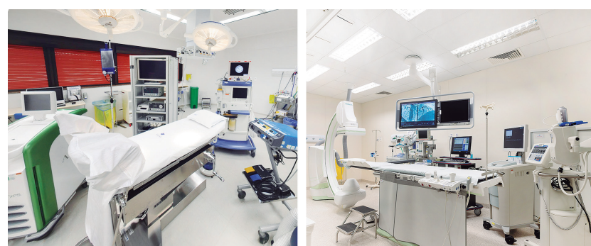
Alta tecnologia em equipamentos à disposição das necessidades dos pacientes