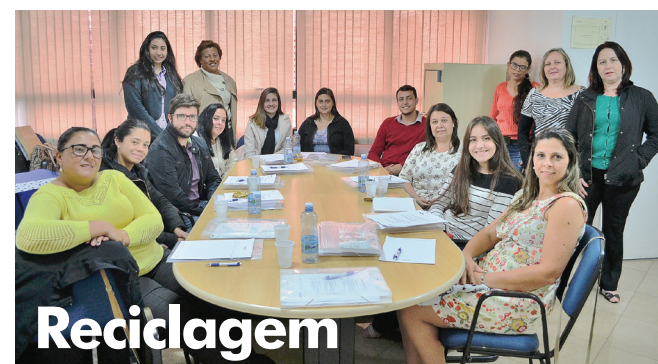
Mais um encontro entre as representantes dos planos nas filiais.

Em caso de dúvidas ligue para o SABe – Serviço de Assistência ao Beneficiário (11) 3473-1617.