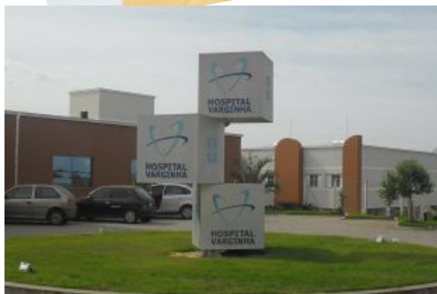
Hospital Varginha, de fácil acesso e localização privilegiada