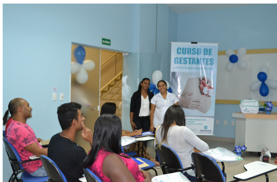
O curso tem duração de seis meses com uma aula mensal ministrada no próprio hospital