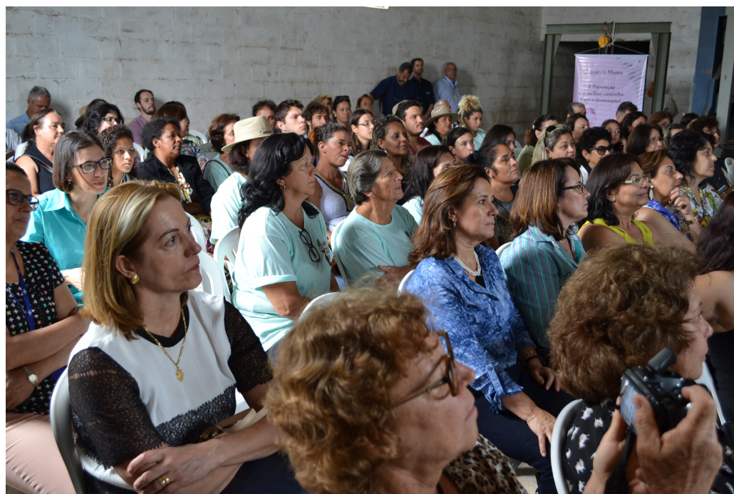
Na Fazenda Capoeira, produtoras avaliam novas perspectivas na produção cafeeira

Representantes do S.P.A. Saúde marcaram presença nos dois encontros, distribuindo materiais sobre a importância da prevenção do câncer de mama e uterino e sobre os benefícios oferecidos por nossos planos aos seus beneficiários. A Diretoria e equipe do S.P.A. Saúde cumprimentam os organizadores pelo sucesso dos eventos que dignificam e valorizam a participação feminina na vida rural brasileira.