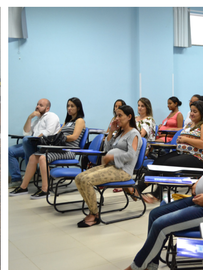
As famílias conhecem as instalações do Hospital Varginha e são orie

Muitas mulheres enfrentam inseguranças e acumulam dúvidas sobre a gravidez, pré-natal, parto e, principalmente, como escolher o hospital ideal para o nascimento de seu bebê. Depois de detectar essa carência de informações, os profissionais do Hospital Varginha implantaram um curso de gestante, totalmente gratuito, oferecido a todas as mulheres grávidas residentes na cidade e regiões próximas.