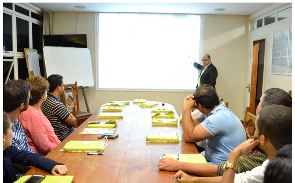
Profissionais médicos de Boa Esperança prestigiaram o encontro

O encontro serviu também para troca de informações e esclarecimentos de dúvidas sobre procedimentos do plano. Os participantes elogiaram a iniciativa encerrada com um lanche servido no próprio local e receberam agendas e brindes institucionais do S.P.A. Saúde.